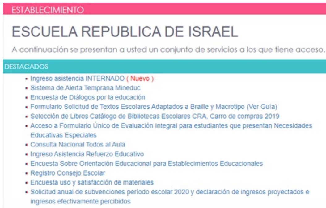
Imagen 2: Enlace de acceso al SAT

En el portal de Inicio, hacer click en el enlace “Sistema de Alerta Temprana Mineduc” , tal como aparece en la siguiente imagen: