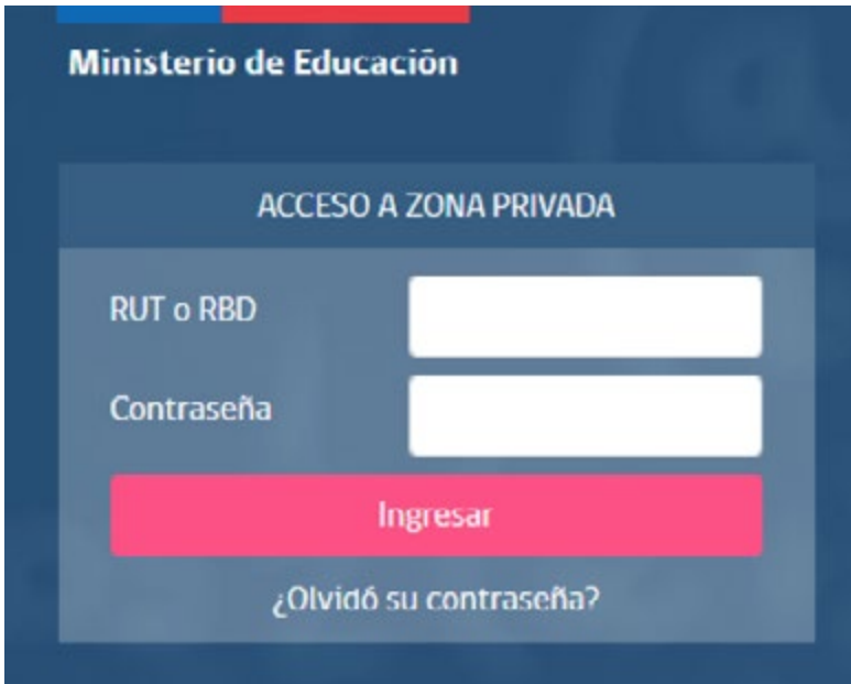
Imagen 1: Acceso a través de Comunidad Escolar

El director (a) debe acceder a Comunidad Escolar con su Rut o RBD y clave de acceso a "Zona Privada" haciendo click en este link: https://www.comunidadescolar.cl/